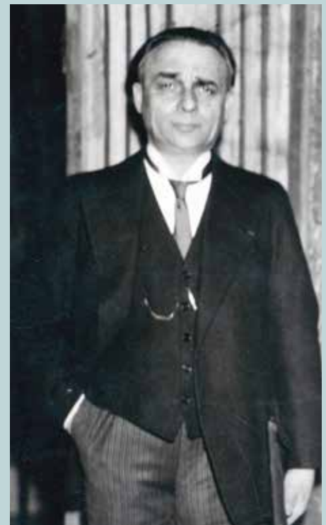
Arthur Vanderpoorten als minister van Openbare Werken, 1939.

Vanderpoorten werd daar Häftlinge 71693 NN, waarbij de NN voor Nacht und Nebel staat. Het Nacht und Nebel -decreet was uitgevaardigd op 7 december 1941 als draconische maatregel tegen de verzetsbewegingen.