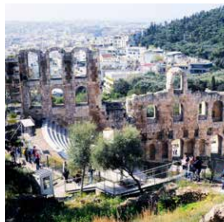
De Acropolis in Athene: de Griekse toeristische sector ligt plat.

De communistenjacht tijdens de Koude Oorlog was niet nieuw in Griekenland. Al onder dictator Ioannis Metaxas, die in 1936 de noodtoestand had uitgeroepen en twee jaar later alle politieke partijen, persvrijheid en stakingen verbod, waren er al serieuze wrijvingen, ook al verwierf hij faam door een Italiaans ultimatum af te doen met zijn ‘Nuts’: “Nee, Ochi”. Ochidag wordt nog altijd gevierd op 28 oktober. De burgeroorlog maakte een eind aan de rol van het linkse Nationaal Bevrijdingsfront/Volksbevrijdingsleger EAM-ELAS dat na de nederlaag van Italië drievijfde van het Griekse grondgebied beheerste (en voor de eerste keer verkiezingen hield mét stemrecht voor de vrouwen). De Griekse communistische partij (KKE) werd daarna verboden, verschillende leiders terechtgesteld, de laatste in 1954. Onder een andere naam won ze wel de verkiezingen in 1958. Maar Paul I weigerde de uitslag te aanvaarden. Zelfs de socialistische eerste minister George Papandreou (senior) weigerde later het verbod op te heffen toen Constantijn II zijn oom Paul I opvolgde als