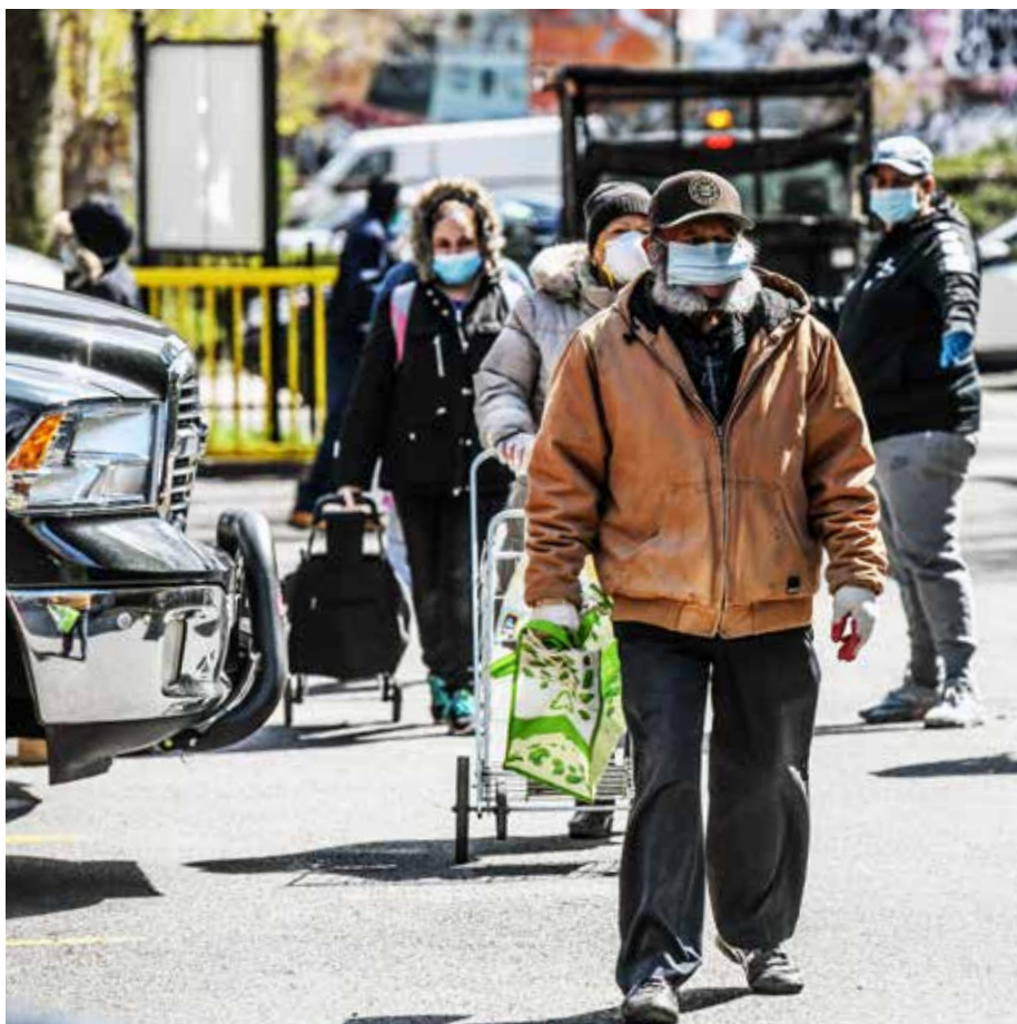
Vooral The Bronx in New York werd hard getroffen.

de gewezen vicepresident Joe Biden uit Delaware alleen over om naar de nominatie te gaan. Hij kan zeker de geldelijke steun van Bloomberg gebruiken, maar zal zeker nog geconfronteerd worden met een minder leuk dossier: de geldelijke transacties van zoon Hunter. De cruciale vraag is nu wie de running mate van Joe Biden wordt? Deze laatste is 78 jaar oud, katholiek en komt traditioneel uit de vakbondsvleugel van de partij. Biden zal op zijn minst moeten zoeken naar een jonger iemand, protestants alsook conservatiever. Een ander probleem is de aanhang van Bernie Sanders. Gaat die linksere aanhang op drie november willen stemmen voor Biden? Daarvoor zou Biden dan een progressievere figuur moeten zoeken als running mate. Maar dit houdt wel het risico in op verlies in het centrum aan Donald Trump.