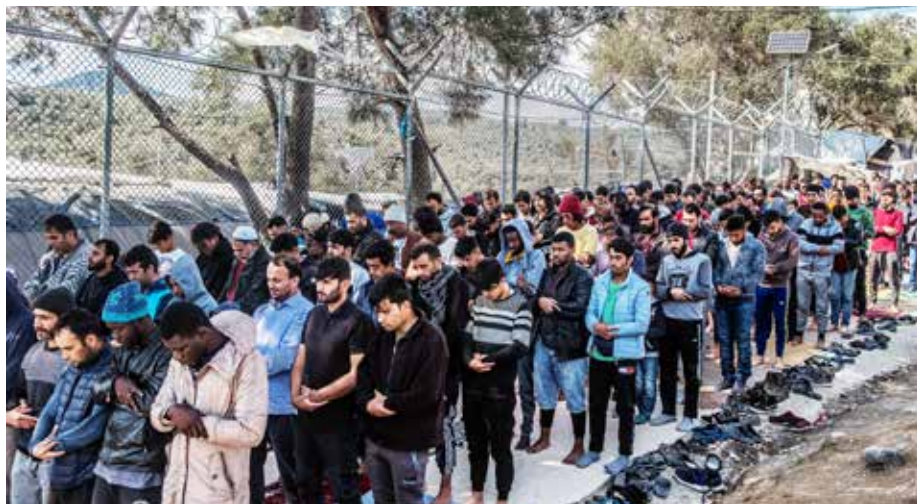
Een groep migranten aan het bidden voor de omheining van een vluchtelingenkamp op het Griekse eiland Lesbos.

Eerste minister Georgios Papandreou (junior) gaf de fouten grif toe. De rijkste ondernemers betaalden geen euro belasting, met name de reders (die hun zetel buiten het land hielden), de orthodoxe kerk (die de belangrijkste grootgrondbezitter is en geen belasting hoeft te betalen), de vastgoedmafia (omdat er een wet was op braakliggend land, dat na tien jaar voor alle doeleinden mocht gebruikt worden; de grote bosbranden langs de kust of in de bergen waren zelden toeval). Kwam daarbij het ingekankerde “dienstbetoon”, en de stelselmatige niet-betaling van belastingen, en de zwakte van Athene was helemaal blootgelegd. Toen zich daarop nog de migratiecrisis entte en de onwelvoeglijke aanpak van die crisis door de Europese Unie, “begrotingsfetsisjisten tegen potverteerders” (waarvan we net een nieuw doordrukje gezien hebben bij de coronakrisis), was het land veroordeeld tot